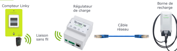
SCHÉMA D'IMPLANTATION DE LA SOLUTION TETRALINK CHARGE

Conformément au Code général des impôts, annexe IV Article 18 ter A , le système de charge doit être pilotable . Cela signifie qu'il doit être doté d'une capacité à moduler la puissance appelée ou à programmer la recharge du véhicule électrique.